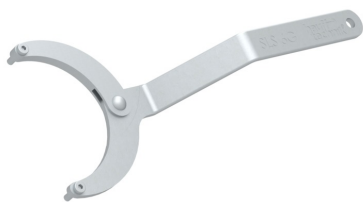
Klucz do pokryw